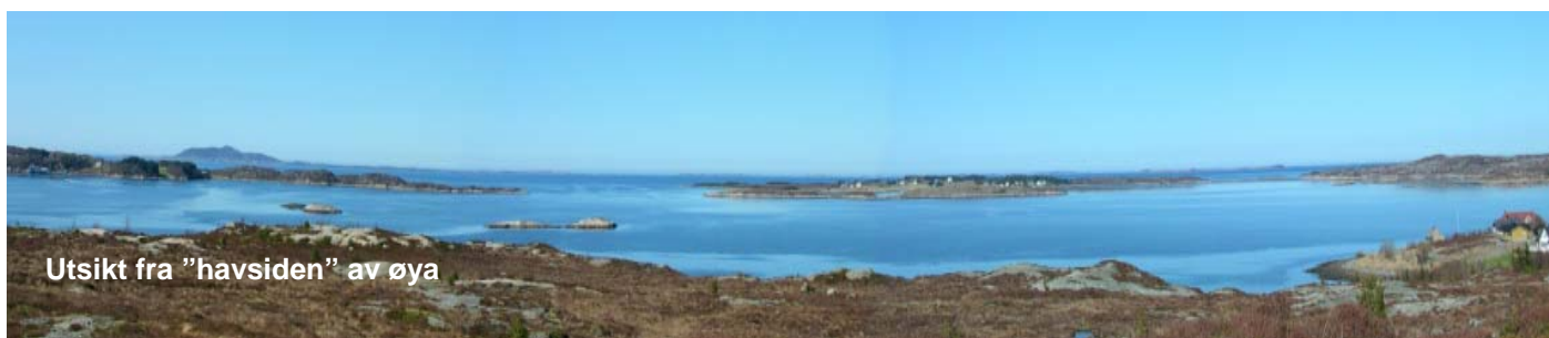
Utsikt fra "havsiden" av øya

I Midsund møter vi igjen asfalten. Nå skal vi gjennom Midsund sentrum og så over til nordsiden av øya. Fra idrettsbanen er det gangvei et kort stykke, på venstre side av veien. Deretter på relativt flat vei forbi Ugelvik, Rakvåg og Ræstad. Like etter Rakvåg passerer vi til venstre for Rørset/Ræstadhornet . (se egen turbeskrivelse). I nordøst skal vi opp ca. 60 meter, deretter svinger og mindre oppoverbakker før vi kan kjøre ned den lange bakken til fergeteiet.