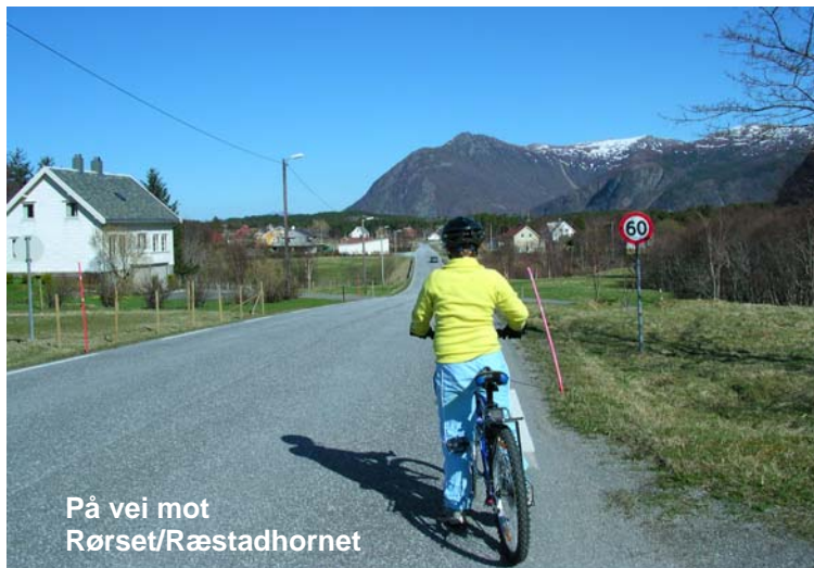
På vei mot Rørset/Ræstadhornet

I Midsund møter vi igjen asfalten. Nå skal vi gjennom Midsund sentrum og så over til nordsiden av øya. Fra idrettsbanen er det gangvei et kort stykke, på venstre side av veien. Deretter på relativt flat vei forbi Ugelvik, Rakvåg og Ræstad. Like etter Rakvåg passerer vi til venstre for Rørset/Ræstadhornet . (se egen turbeskrivelse). I nordøst skal vi opp ca. 60 meter, deretter svinger og mindre oppoverbakker før vi kan kjøre ned den lange bakken til fergeteiet.