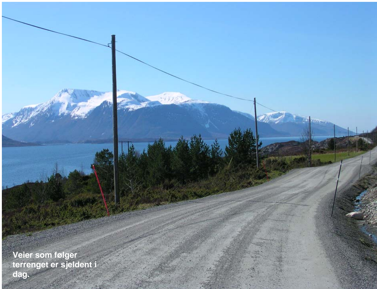
Veier som følger terrenget er sjeldent i dag.